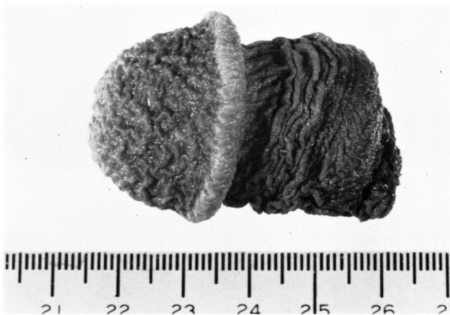
Fig. 1. 切断した陰茎

手術所見. 止血のため根部をネラトンで緊縛し, 応急処置のひもをはずすと, 創面は凝血で被覆されていた. 凝血を除去し根部のネラトンをゆるめても出血を認めず, 完全に止血していると思われた. 陰茎は根部から約2 cmの部位で完全に切断され, その創面(Fig. 2)は平坦で, 陰茎海綿体, 尿道海綿体, 尿道, 陰茎背動静脈および深動脈が明確に識別できた. そこ