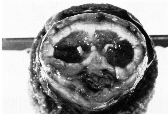
Fig. 2. 陰茎切断端